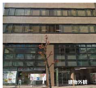
(地下鉄伏見駅4番出口より徒歩3分)