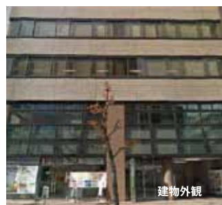
(地下鉄伏見駅4番出口より徒歩3分)